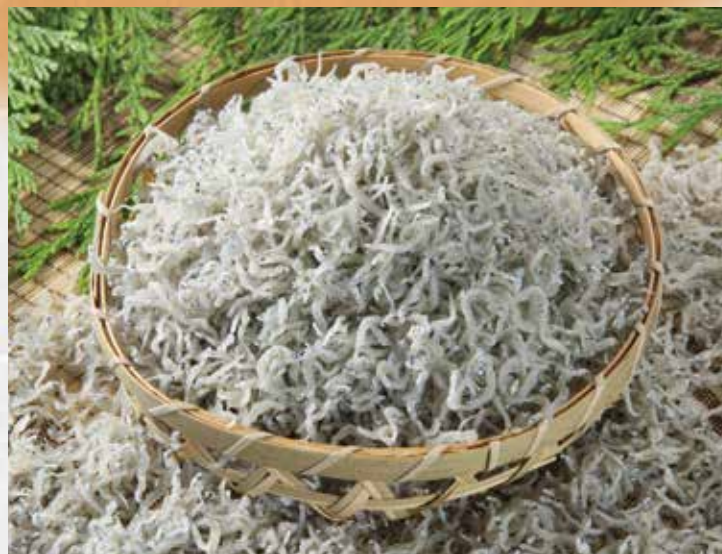
大分県のちりめんを使用し、自然の旨味を最大限に引き出しました。