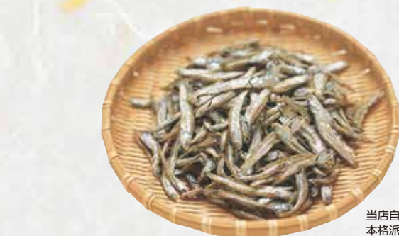
当店自慢の旨味たっぷり本格いりこです。

ちりめん クール便 5,400円(税込) 1kg(500g×2)/箱入り [本体価格5,000円]