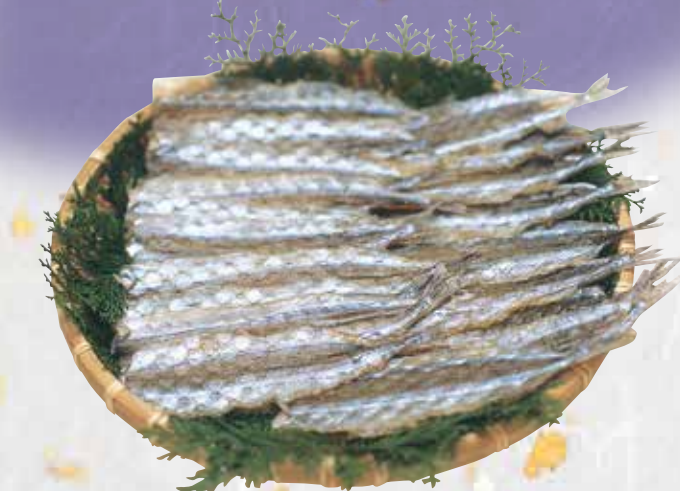
※写真は350gの場合です。新鮮なサヨリを上品に仕上げました。骨が無く、大変食べやすくなっております。