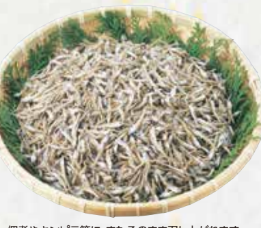
佃煮やキンピラ等に。またそのまま召し上がれます。カルシウム補給にどうぞ。

いりこ 常温 3,780円(税込) 1kg [本体価格3,500円] ※1kg(500g×2)/箱入り