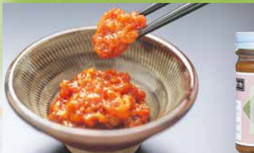
新鮮なうにを食べやすくピンに詰めました。酒の肴やご飯の友、様々な料理にどうぞ。