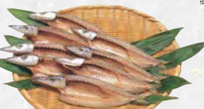
※骨ごと召し上がれます。カルシウム補給にどうぞ。

いわし丸干し(一夜干し) クール便 270~302円(税込) 1串(5~7尾)袋入り [本体価格250~280円]