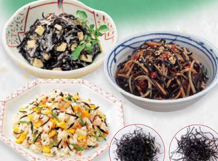
ひじき本来の味と食感をひきだし、シャキッとした食感が特徴です。

昔ながらの製法の良さを活かした設備で、ひじき本来の味わいをたっぷりと引出しました。