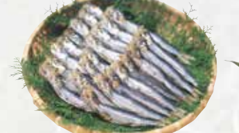
※骨ごと召し上がれます。カルシウム補給にどうぞ。

生あじ開き クール便 378円(税込) 2~3尾/袋入り [本体価格350円] ※箱入りの場合は箱代が別途かかります。